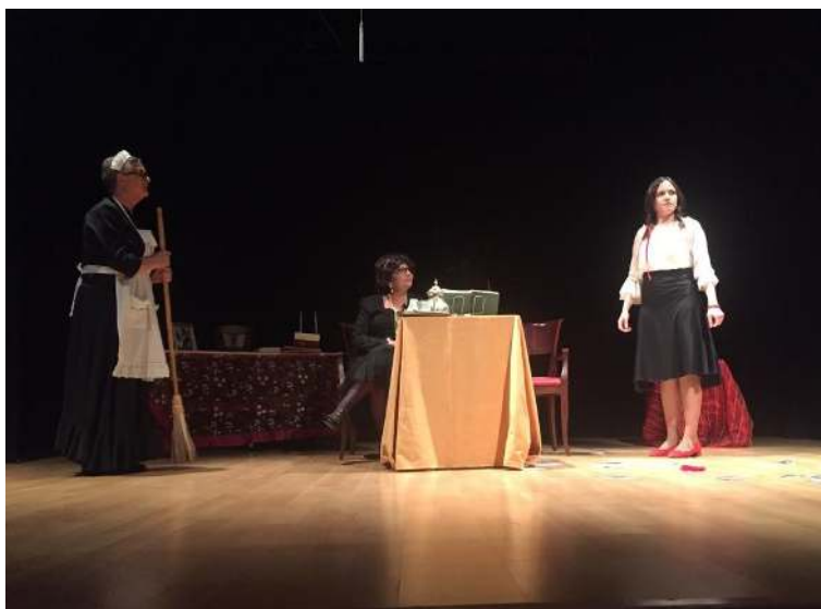
Recordando a Ramón Gómez de la Serna.