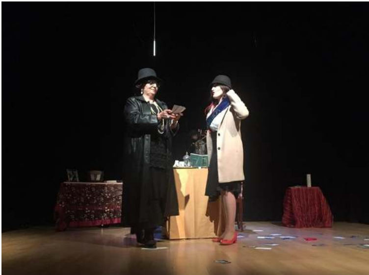
Las Cármenes y las luchas por el sufragio femenino.