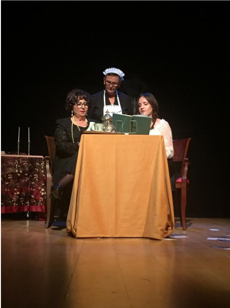
Repasando recuerdos de “El Barranco del lobo”.