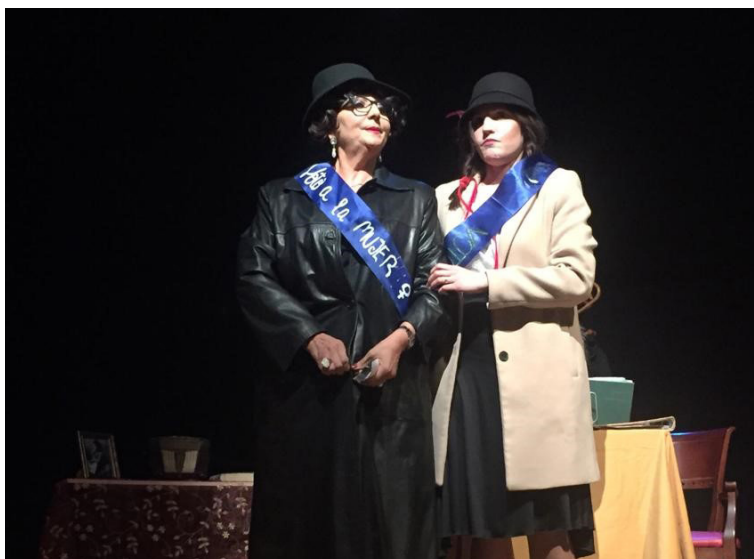
Siguen las luchas por el sufragio femenino