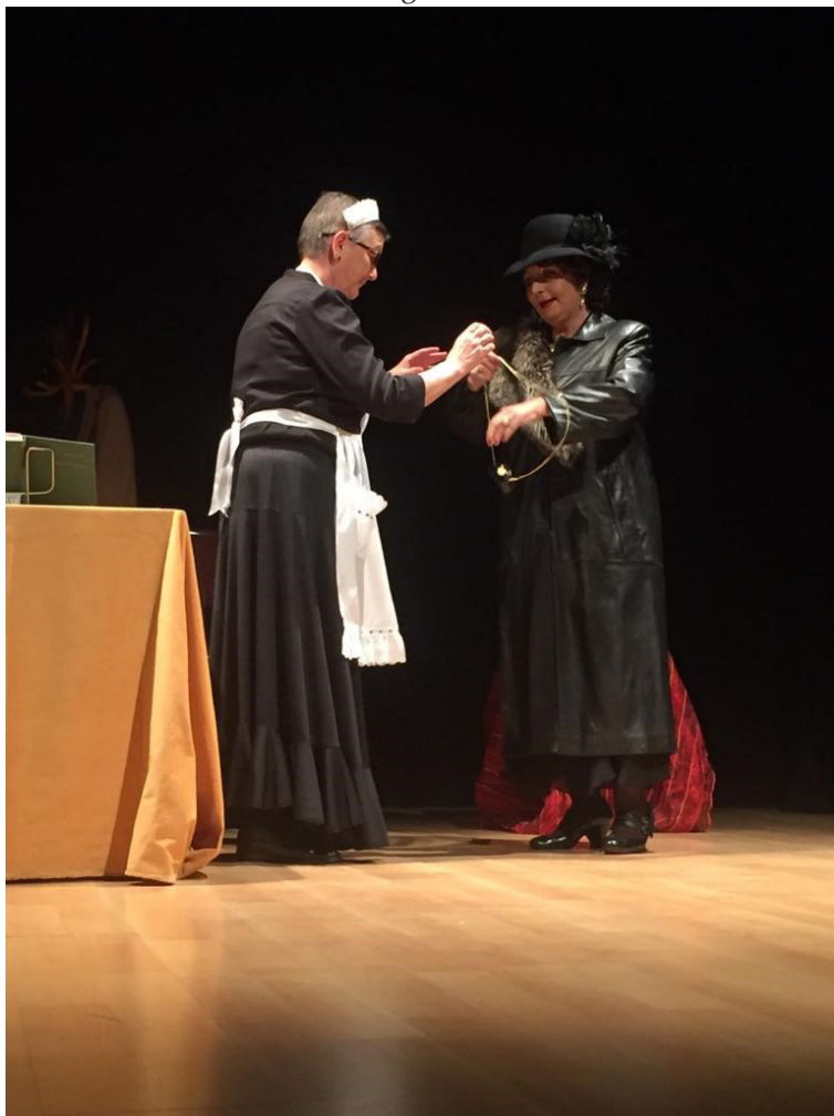
Entrada de Carmen..