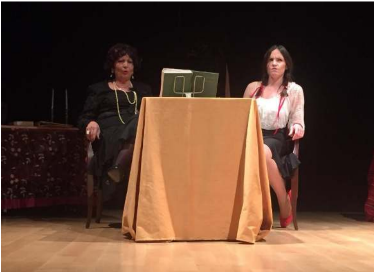
Desencuentro entre las Cármenes.